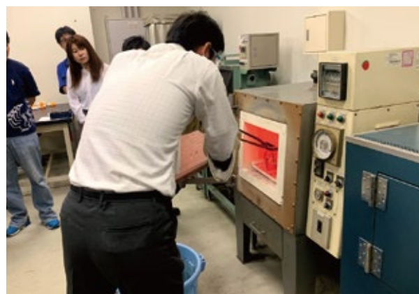
まっすぐなピアノ線を熱処理でかたくしたりやわらかくしたりします