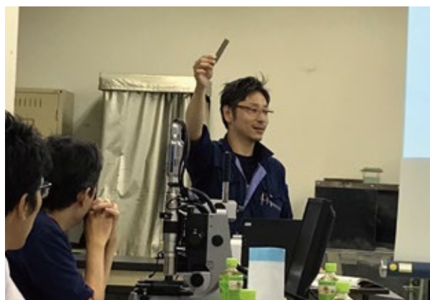
材料の硬さの違いを曲げて体験してみます