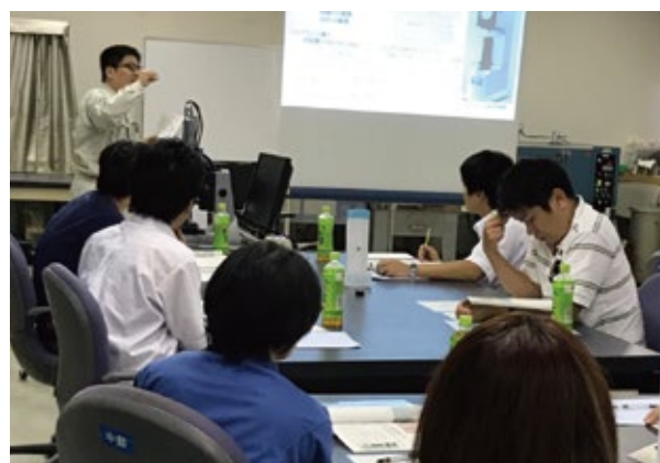
座学です。硬さ試験器の説明中