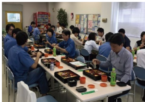
参加者同志の交流。仕事の上でのお困りごと ディスカッション